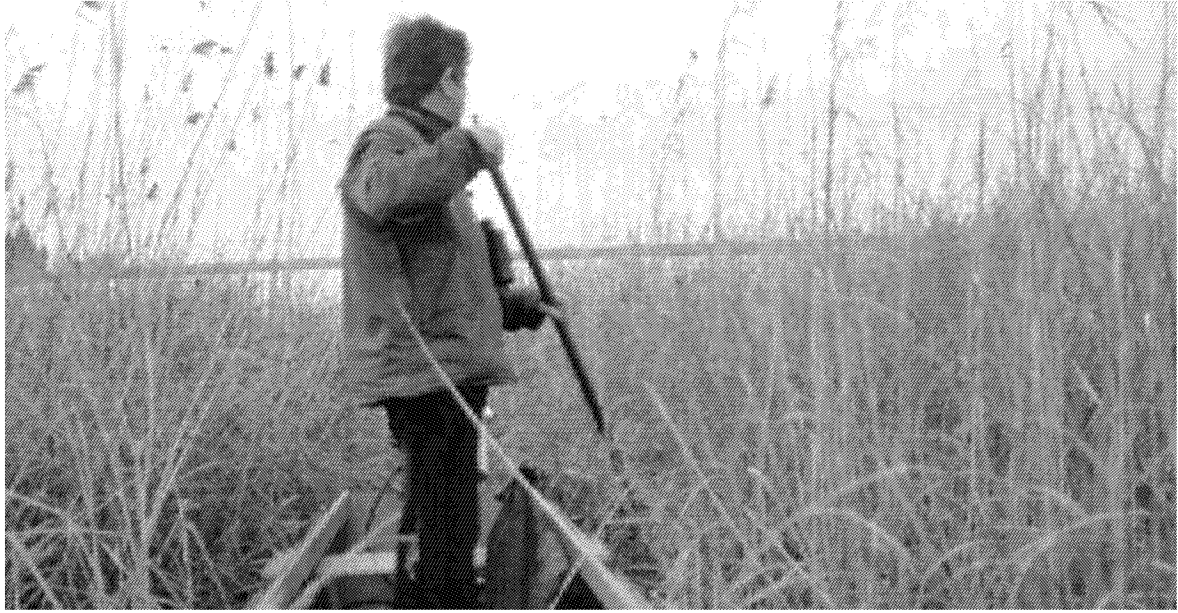
PARCO La navigazione tra i falaschi del padule è spesso tortuosa come le vie della politica viareggina