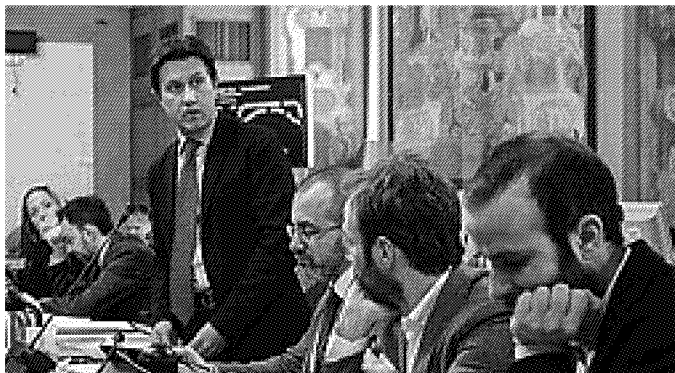
Il sindaco Dario Nardella durante il suo intervento in Consiglio